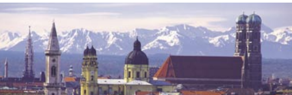
Bei schönem Wetter glaubt man, die Alpen sind zum Greifen nah, direkt vor den Toren Münchens. Die TowerCam eröffnet Ihnen einen einmaligen Blick auf dieses Naturschauspiel.

Genießen Sie den Ausblick auf www.t-info.de/towercam